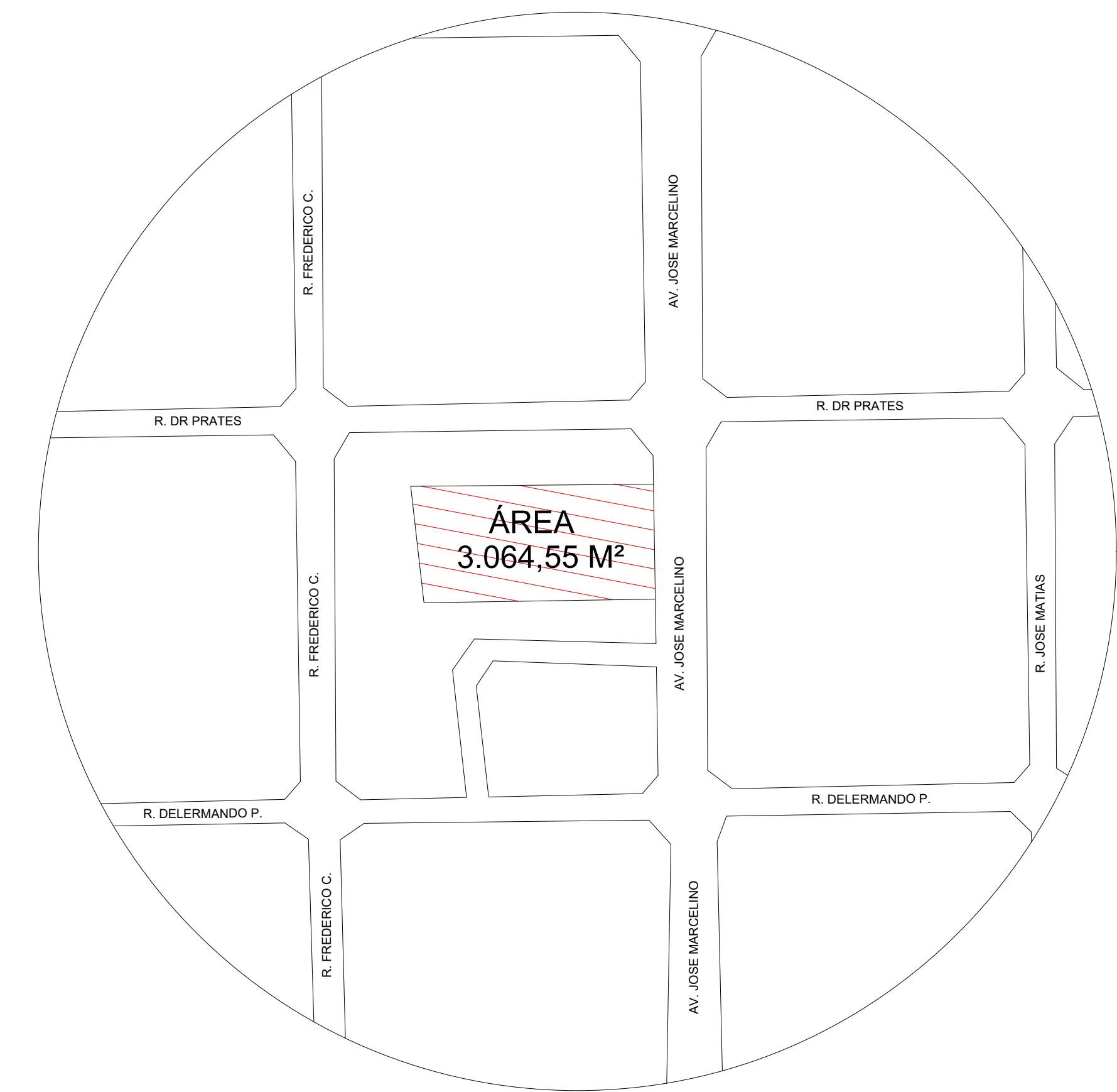
PLANTA DE SITUAÇÃO Escala: 1/700