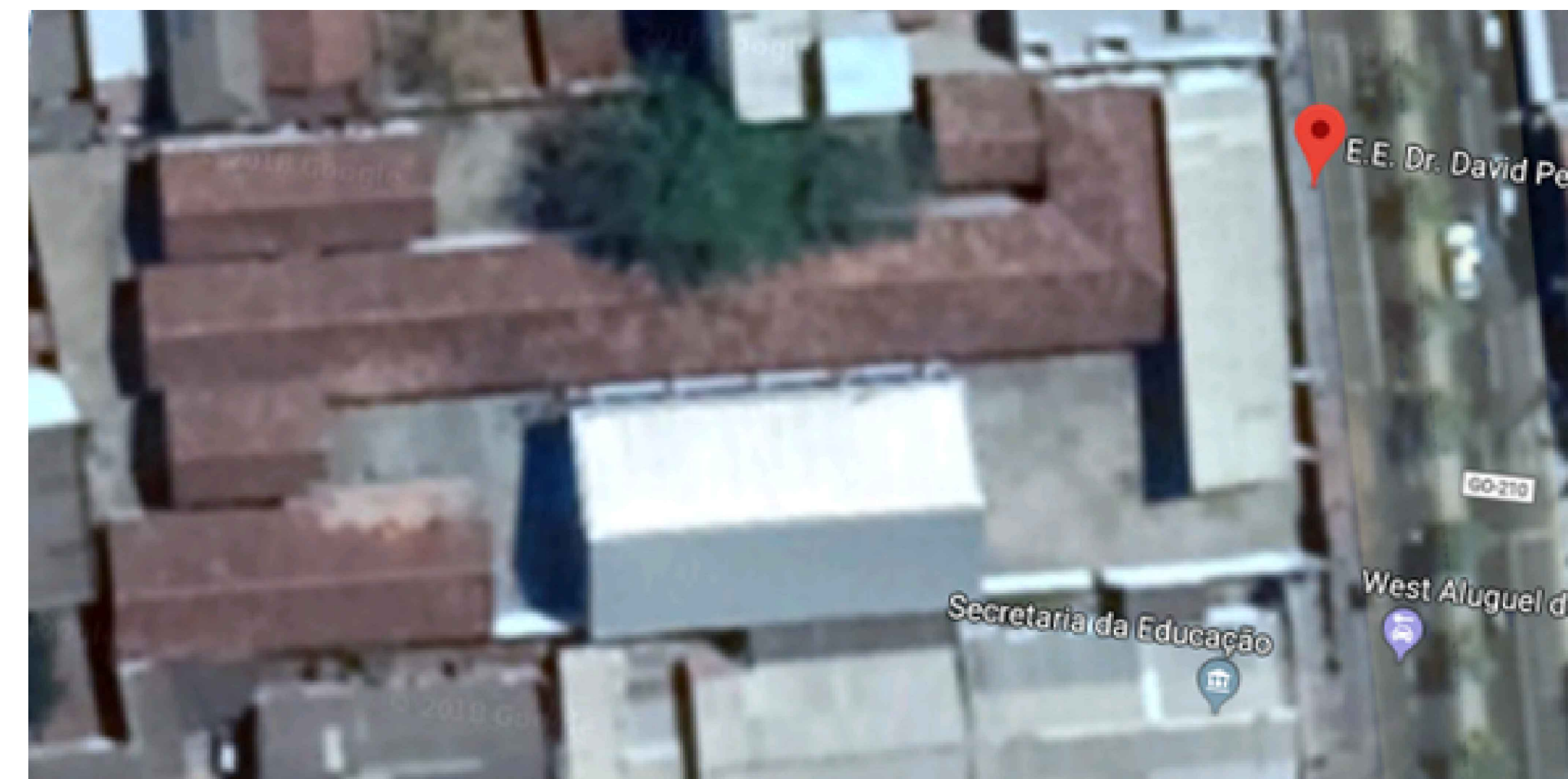
PLANTA DE LOCALIZAÇÃO Sem Escala